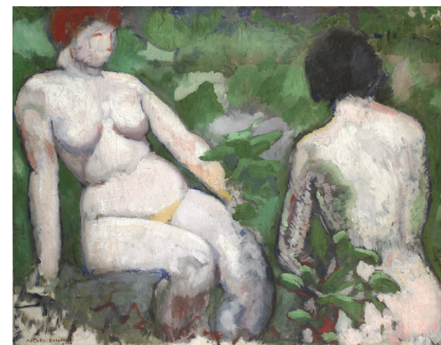
Marcel Duchamp (1887 - 1968) Deux nus, 1910 Huile sur toile 73 x 92 cm. Achat, 1975 (N° Pompidou: AM 1975-55). inv. D 1998.2.3 | Dépôt du Centre Pompidou; Rouen; Musée des Beaux-Arts, 1998.