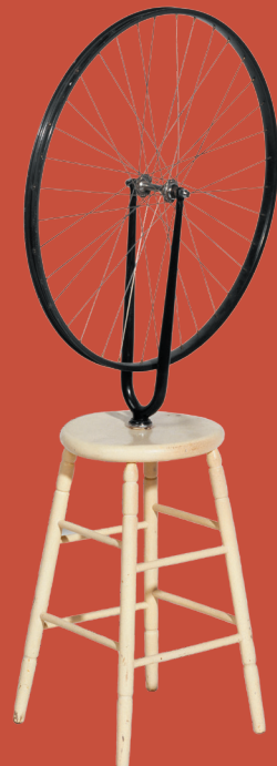
Marcel Duchamp (1887-1968), Roue de bicyclette 1913/1964, Localisation: Paris, Centre Pompidou - Musée national d'art moderne - Centre de création industrielle.

au cimetière monumental de Rouen sur lequel il a fait graver la célèbre épitaphe D'ailleurs, ce sont toujours les autres qui meurent. Le musée des Beaux-Arts de Rouen fait partie du cercle de ses motifs. À l'issue d'une carrière internationale, c'est au musée des Beaux-Arts qu'il organise en 1967 une grande exposition Les Duchamp , qui rassemble ses œuvres ainsi que celle de ses frères Raymond Duchamp-Villon, Jacques Villon, et de sa sœur, Suzanne Duchamp. En 1968, Marcel Duchamp est inhumé