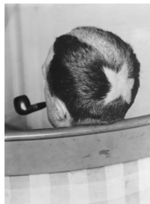
Marcel Duchamp (1887-1968) / Georges de Zayas (1898-1967), Emmanuel Rudzitsky, dit Man Ray (1890-1976) La Tonsure, 1921. Tirage original.